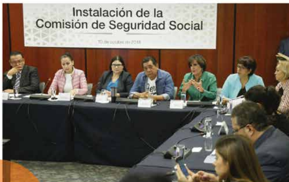
La Comisión de Seguridad Social es de suma importancia. Sin duda, es una asignatura con grandes retos en el país.

En el marco de las actividades de esta Comisión, también participé como moderadora en la mesa "El estado actual de la seguridad social y los sistemas de seguridad social. Beneficios y prestaciones", durante la Semana de la Seguridad Social 2019.