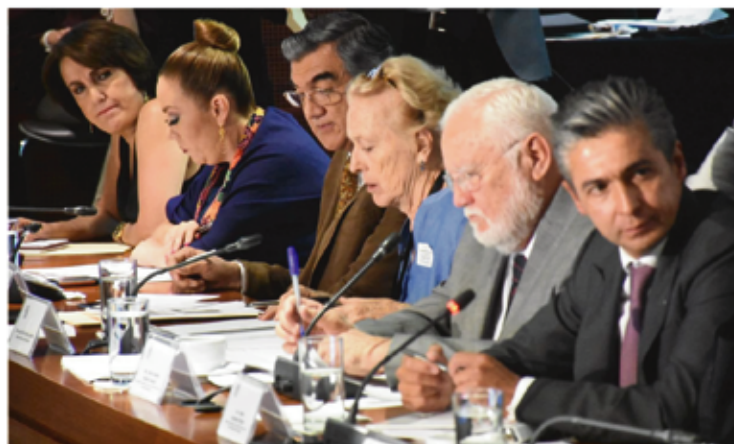
En la Comisión de Salud nos tocó recibir a los titulares de Cofepris de la administración anterior y de la actual. A ambos les cuestioné la falta de reglamento para el uso medicinal, terapéutico e industrial de la marihuana.

en cientos de miles de homicidios en nuestro país en las últimas décadas. Cambiemos las reglas.