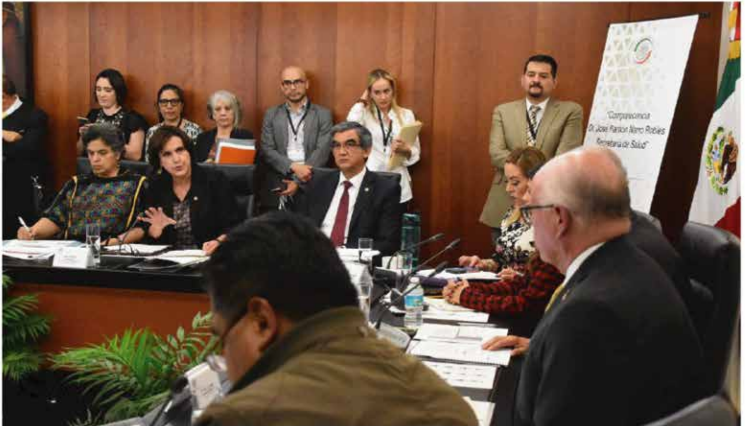
La Comisión de Salud es una de las más activas y en varias ocasiones hemos atendido comparecencias de titulares de dependencias, como la Secretaría de Salud.