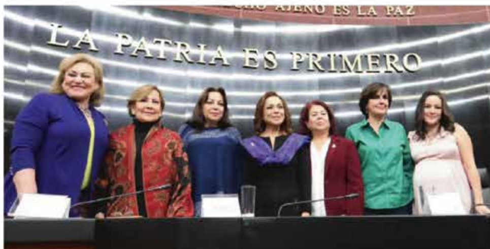
En la Comisión de Derechos de la Niñez y de la Adolescencia mi prioridad es la atención a las altas tasas de embarazo infantil y adolescente.

Como integrante de la Comisión de Derechos de la Niñez y de la Adolescencia de la H. Cámara de Senadores estuve activa en cinco sesiones ordinarias y una reunión en Comisiones Unidas de Derechos de la Niñez y de la Adolescencia, y de Estudios Legislativos: